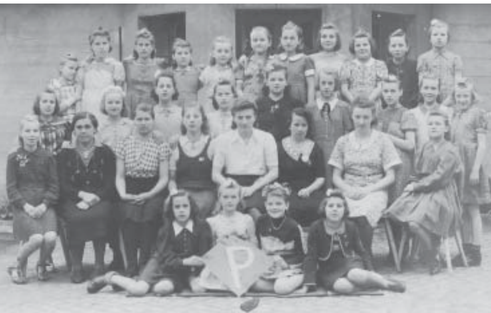
Foto: Historisches Foto aus dem Privatbesitz von Sabina Giza, ehemalige Zwangsarbeiterin

Mädchen und Frauen aus Polen, Russland und der Ukraine, die zwischen 1943 und 1945 als Zwangsarbeiterinnen in den Kautabakfabriken Hanewacker und Kneiff in Nordhausen am Harz eingesetzt waren.