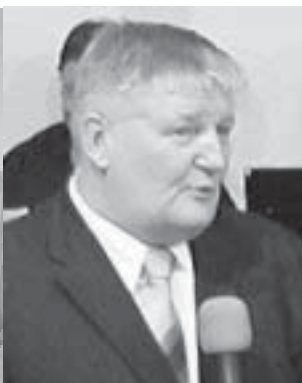
Artistenschule Contraire in Köpenick