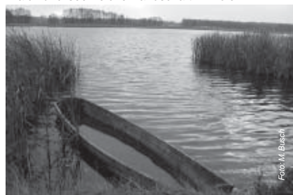
Wald- und seenreiche Landschaft in Polen

sind das kleinste slawische Volk. Sie sind Nachfahren jener slawischen Stämme, die im Zuge der Völkerwanderung vor mehr als 1 400 Jahren das Land zwischen Oder und Elbe/Saale, zwischen Ostsee und den deutschen Mittelgebirgen besiedelten. Nach dem Verlust der politischen Selbstständigkeit im 10. Jahrhundert verringerte sich ihr Siedlungsgebiet durch Assimilation und durch eine zielgerichtete Germanisierung. Lediglich den Nachkommen der oberlausitzischen Milzener und der niederlausitzischen Lusizer ist es gelungen, bis in die Gegenwart ihre sorbische/wendische Sprache und Kultur zu erhalten. Die Sorben/Wenden haben kein Muttervolk in den angrenzenden Staaten.