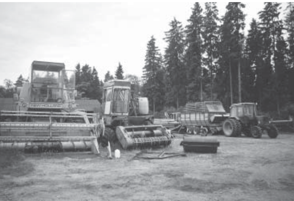
Stück für Stück wird die alte Technik ersetzt

handelt es sich um Restitutionsland, das er für 300 bis 400 Kronen je ha von Nachbarn gepachtet hat. Ein Hektar Land kostet – je nach Lage und Güte – zwischen 20 000 und 200 000 Kronen. Das Wohnhaus macht einen soliden, gepflegten Eindruck.