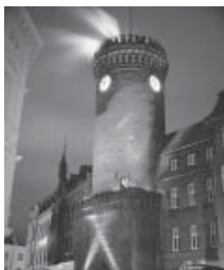
Der Spremberger Turm, das Wahrzeichen der Stadt

der technischen Infrastruktur der Wojewodschaft. Die größten Entwicklungsfortschritte wurden bei der Telekommunikation und in der Abwasserwirtschaft gemacht.