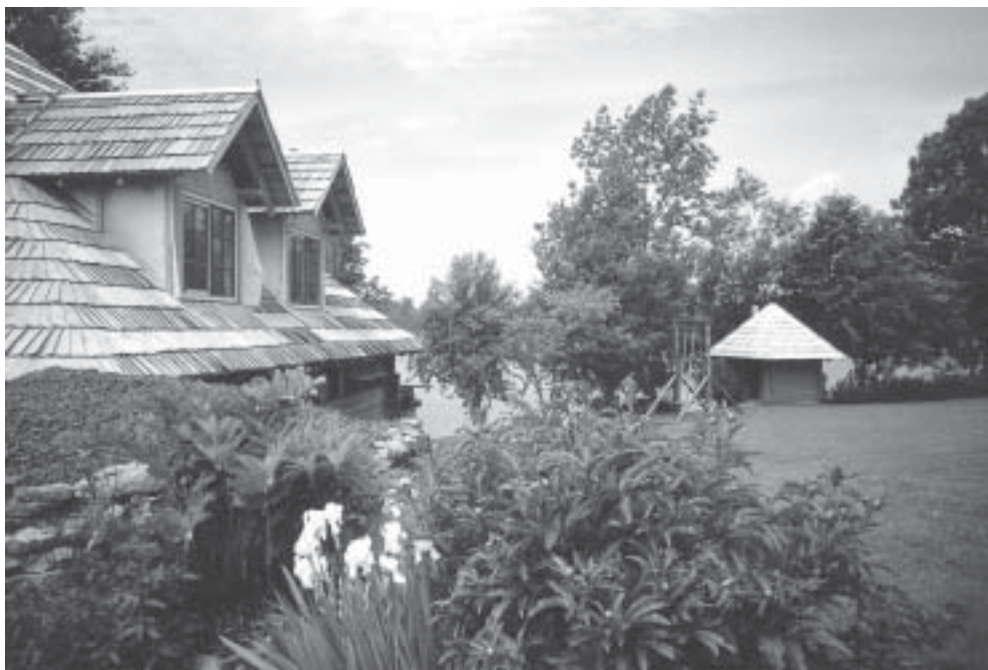
Investitionen für die Zukunft im ländlichen Tourismus

In den ersten Jahren waren die Getreideerträge mit 15 bis 18 dt/ha sehr bescheiden. Das hing damit zusammen, dass die Böden durch die schweren russischen Maschinen sehr verdichtet waren. Unkraut wie Quecke und Flughafer bereiteten Probleme, teilweise jetzt noch. „Aber“, so sagt Krainbring, „bald werden es wohl 40 bis 55 dt sein und ich bin sicher, dass wir in fünf Jahren für den Westen produzieren.“ Düngemittel holt er sich aus Litauen, Pflanzenschutzmittel aus Deutschland, weil sie preiswerter sind als im Baltikum. In zwei Hallen können nach der Trocknung